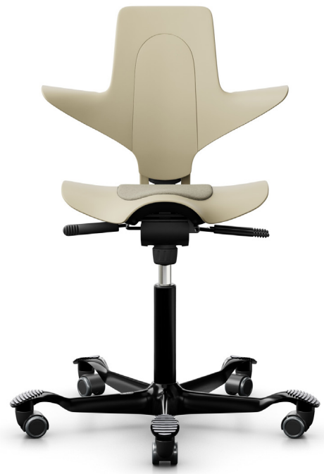
Design: Peter Opsvik. Patent- und Designgeschützt.